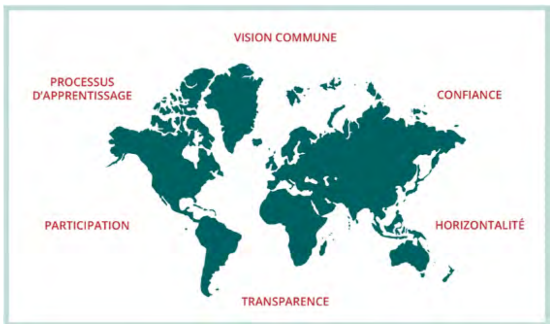
Figure 1. Les éléments clés des SPG.

En 2019, l'IFOAM recensait 223 initiatives réparties dans 76 pays dont 166 étaient pleinement opérationnelles. Certains SPG sont reconnus par cette même organisation, d'autres le sont par des autorités locales (en particulier en Amérique du Sud), d'autres encore sont leur propre garant 10 .